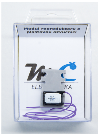
(a) Foto produktu v balení