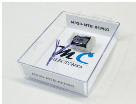
(a) Foto produktu v balení